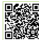
兒童單車課程詳細內容